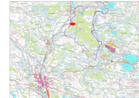
Kuva 1: Sakatin sijainti punaisella ympyrällä merkittynä. Viiankiaavan Natura 2000 -alue on merkitty kuvaan violetilla ääriviivalla.